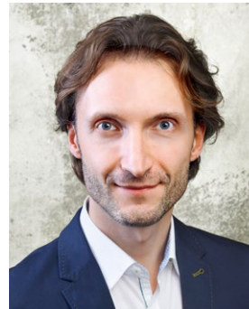
Felice Fornabaio Medienverwaltung Copyrightmanagement

T +49 30 206 29 98-16 f.fornabaio@f-v-v.de